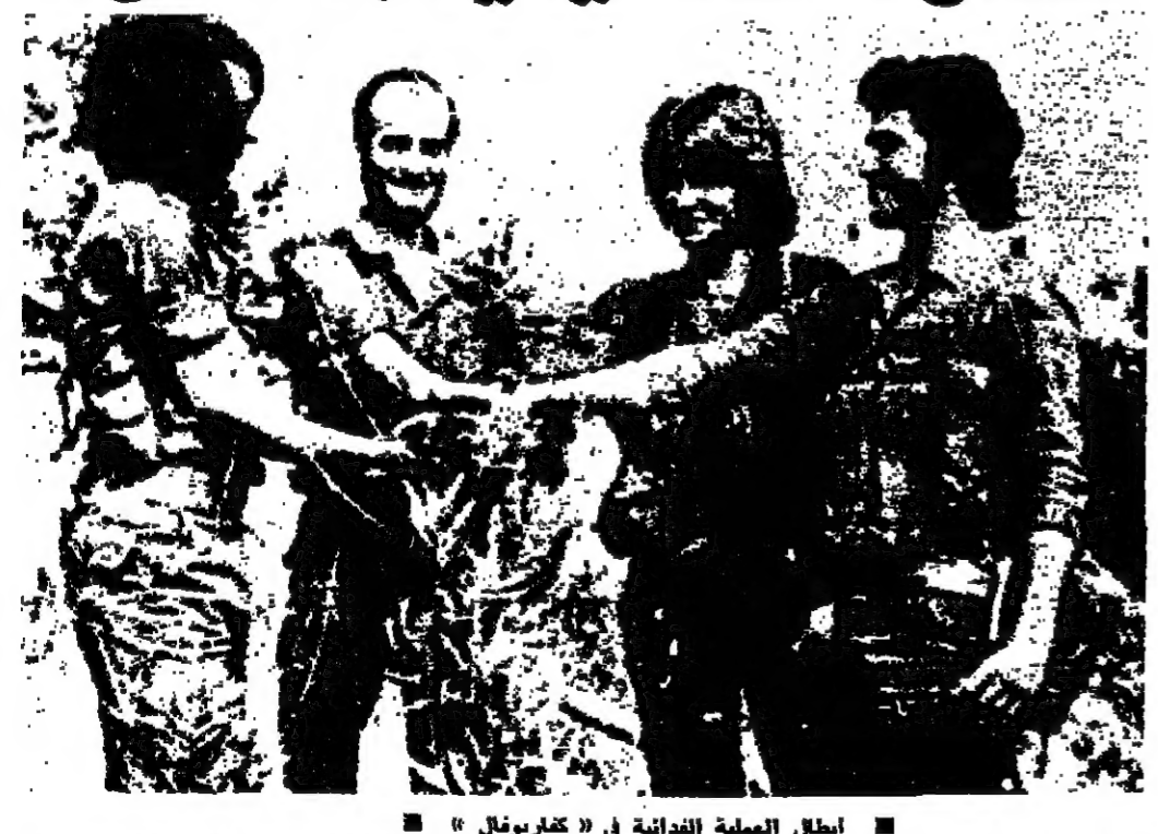
ابطال العملية الفدائية في «كافريونال»